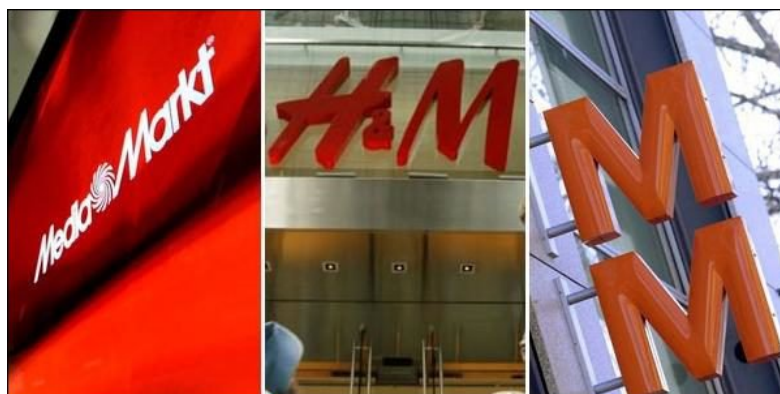
Media Markt, H&M et Migros sont les enseignes préférées des jeunes Helvètes.

par Deborah Sutter/Olivia Fuchs - Les Suisses âgés entre 12 et 30 ans achètent leurs habits chez H&M, leurs produits électroniques chez Media Markt et leurs aliments à la Migros, selon une récente étude.